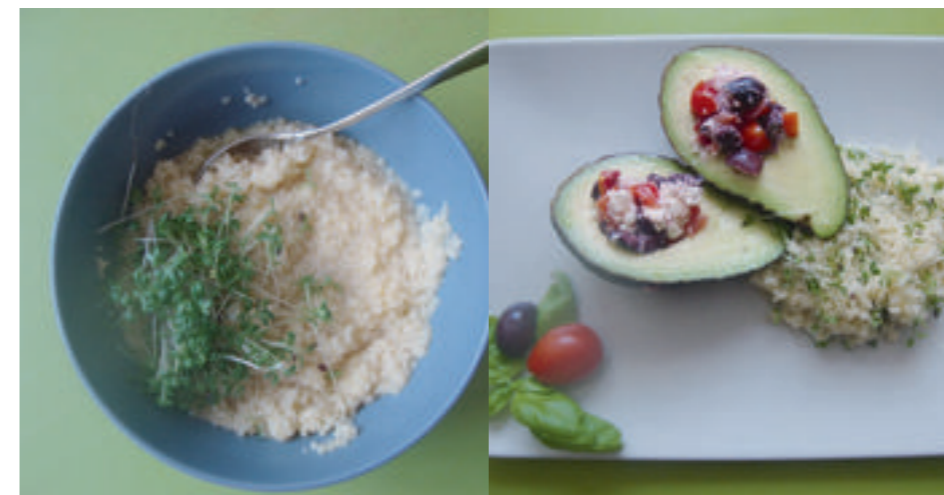
3. Couscous, einen Schuss Olivenöl und eine Prise Salz in 550ml kochendem Wasser aufquellen lassen. Kresse ernten und unter den heißen Couscous mischen.