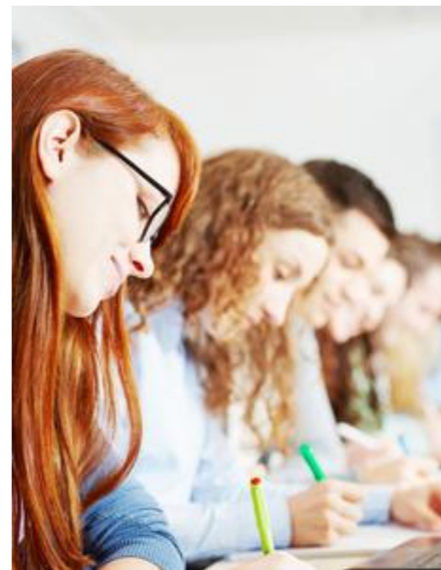
53 Prozent der WU-Studierenden belegen im ersten Jahr weniger als 16 ECTS.

40 Prozent aller Studienanfänger machen im ersten Jahr kaum bis gar keine Prüfungen. Davon sind 24 Prozent vollkommen »studieninaktiv« (0 ECTS im ersten Studienjahr) und 16 Prozent »prüfungsinaktiv« (weniger als 16 ECTS im ersten Studienjahr). Das geht aus einer Studie des Instituts für Höhere Studien (IHS) hervor. Allen voran ist die WU mit 53 Prozent, dicht gefolgt von der Uni Wien mit 50 Prozent. Ein weiteres Ergebnis der Studie ist das Phänomen der hohen Drop-Out-Rate in Österreich, welche aus der umgekehrten Abschluss- oder Erfolgsquote berechnet wird. Dinge, wie Studienwechsel, Studienunterbrechungen oder Mehrfachinskriptionen werden hierbei nicht berücksichtigt, was das Ergebnis quantitativ überschätzt. Außerdem sind 34 Prozent der inaktiven Studierenden mit ihrer Abschlussarbeit beschäftigt, was das Ergebnis somit weiter verfälscht. Rektor Badelt sieht in der Studie »hochschulpolitische Sprengkraft«. Eine Lösung zur Senkung der Drop-Out-Rate sehe Badelt unter anderem in strengeren Zugangsregeln und in höheren Stipendien, womit jenen Studierenden geholfen wäre, die nur aus finanziellen Gründen berufstätig sind. Ein weiterer Vorschlag wäre, jedes zusätzliche Studium kostenpflichtig zu machen, um Studierende zu einer Entscheidung zu zwingen.