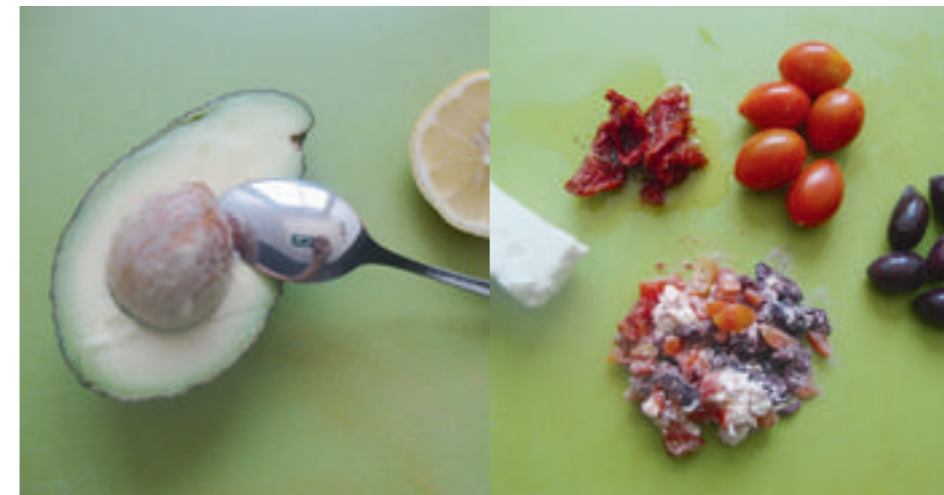
1. Die Avocados in zwei Hälften schneiden, entkernen und mit Zitronensaft bestreichen.