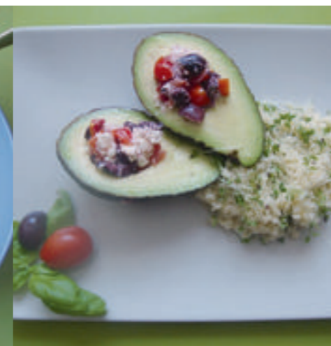
4. Gemüsemasse in die entkernten Avocados füllen, Kresse-Couscous anrichten und mit Basilikumblatt und Cocktailtomate garnieren. Guten Appetit!